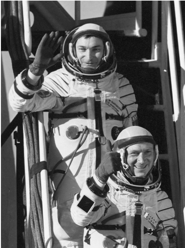
Foto uit 1978 bij het artikel met de titel De eerste Duitser in de ruimte: een Oost-Duitse burger , in het partijblad van de Communistische Partij in de DDR: